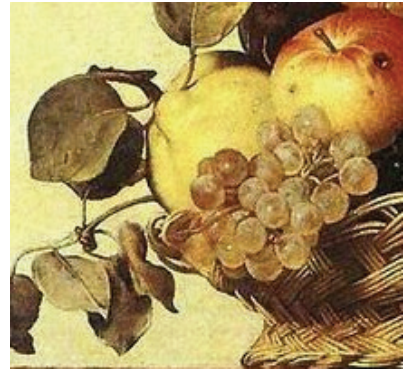
Caravaggios „Fruchtkorb“ (Ausschnitt) 1