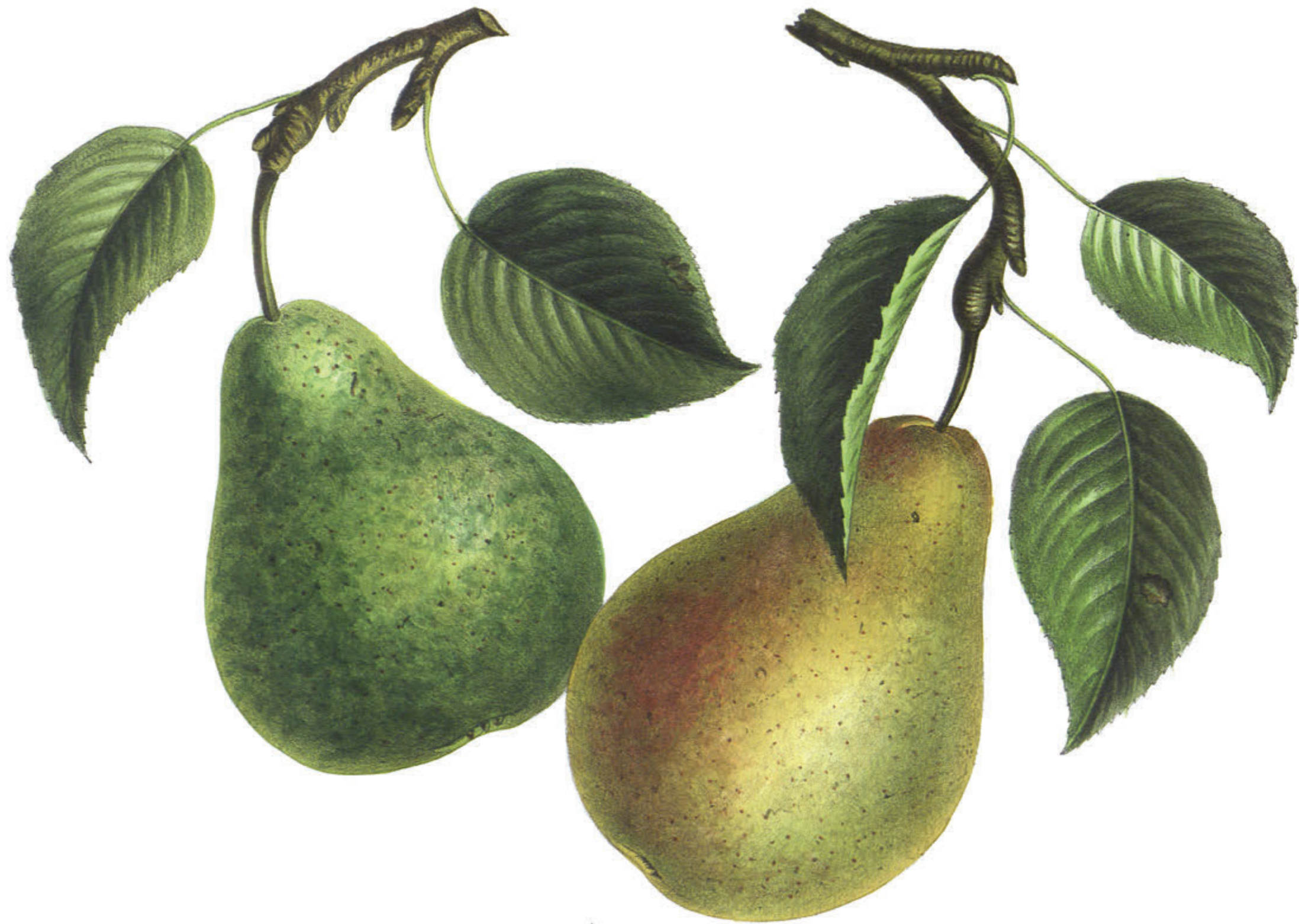
POIRE HENRI (Bisot.)