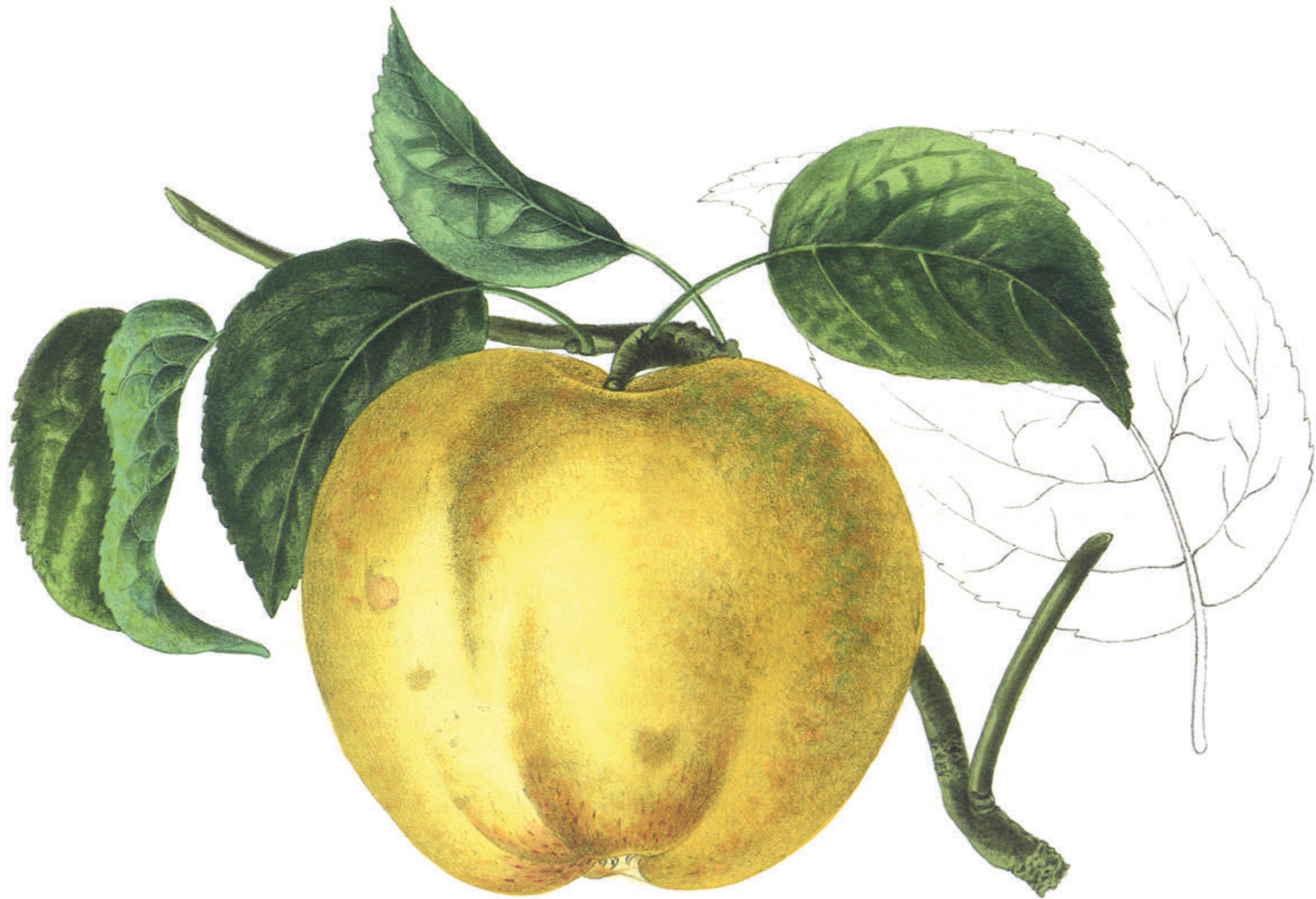
POURME JOSÉPHINE .