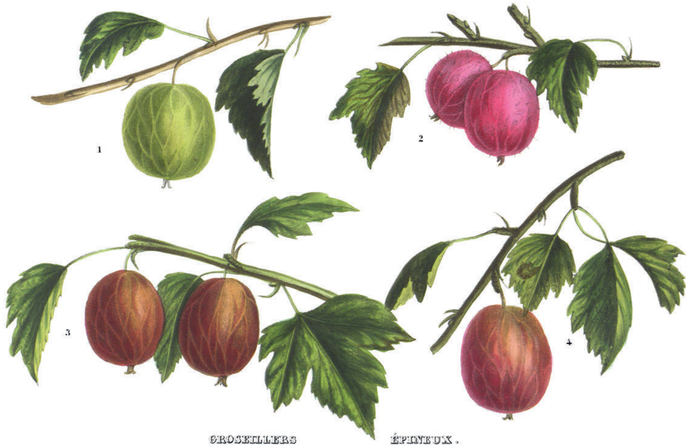
1. YELLOW SMITH, 2. KEW SEEDLING, 3. ROBIN, 4. LADY WARRENDER.